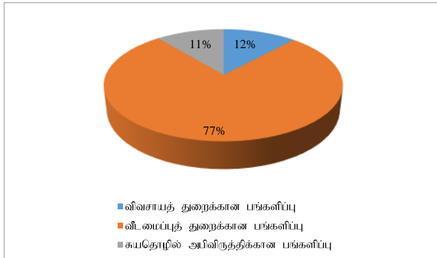
வரைபடம் 13 ஆய்வுப் பிரதேசத்தின் அபிவிருத்திக்கான இலங்கை வங்கியின் மொத்த பங்களிப்பு (1990-2013)

மூலம்:- இரண்டாம் நிலைத் தரவின் தொகுப்பு, இலங்கை வங்கி (1990-2009).