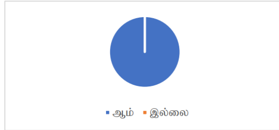
உரு 4.3 பாடசாலை மீதான பெற்றோரின் விருப்பத் தெரிவானது தொடர்ச்சியாகக் காணப்பட வேண்டுமா என்பது தொடர்பான அதிபர்கள் மற்றும் ஆசிரியர்களது தெரிவுகள்.

கிராமப்புறப் பாடசாலைகளின் விளைதிறனை மேம்படுத்துவதற்கு மாணவர்களின் விருப்பத் தெரிவு தொடர்பான தரவுகளைப் பெற்றுக்கொள்வதற்காக அதிபர்கள், ஆசிரியர்களிடம் உங்களுடைய பாடசாலையின் விளைதிறனை மேம்படுத்தவதற்கு மாணவர்களின் தொடர்ச்சியான விருப்பத்தெரிவாக உங்களது பாடசாலையானது காணப்பட வேண்டுமென நினைக்கின்றீர்களா? எனும் வினாவானது வினாக்கொத்தின் வாயிலாக வழங்கப்பட்ட போது அவர்களது தெரிவுகள் பின்வரும் உருவின் மூலமாகக் காட்டப்பட்டுள்ளது.