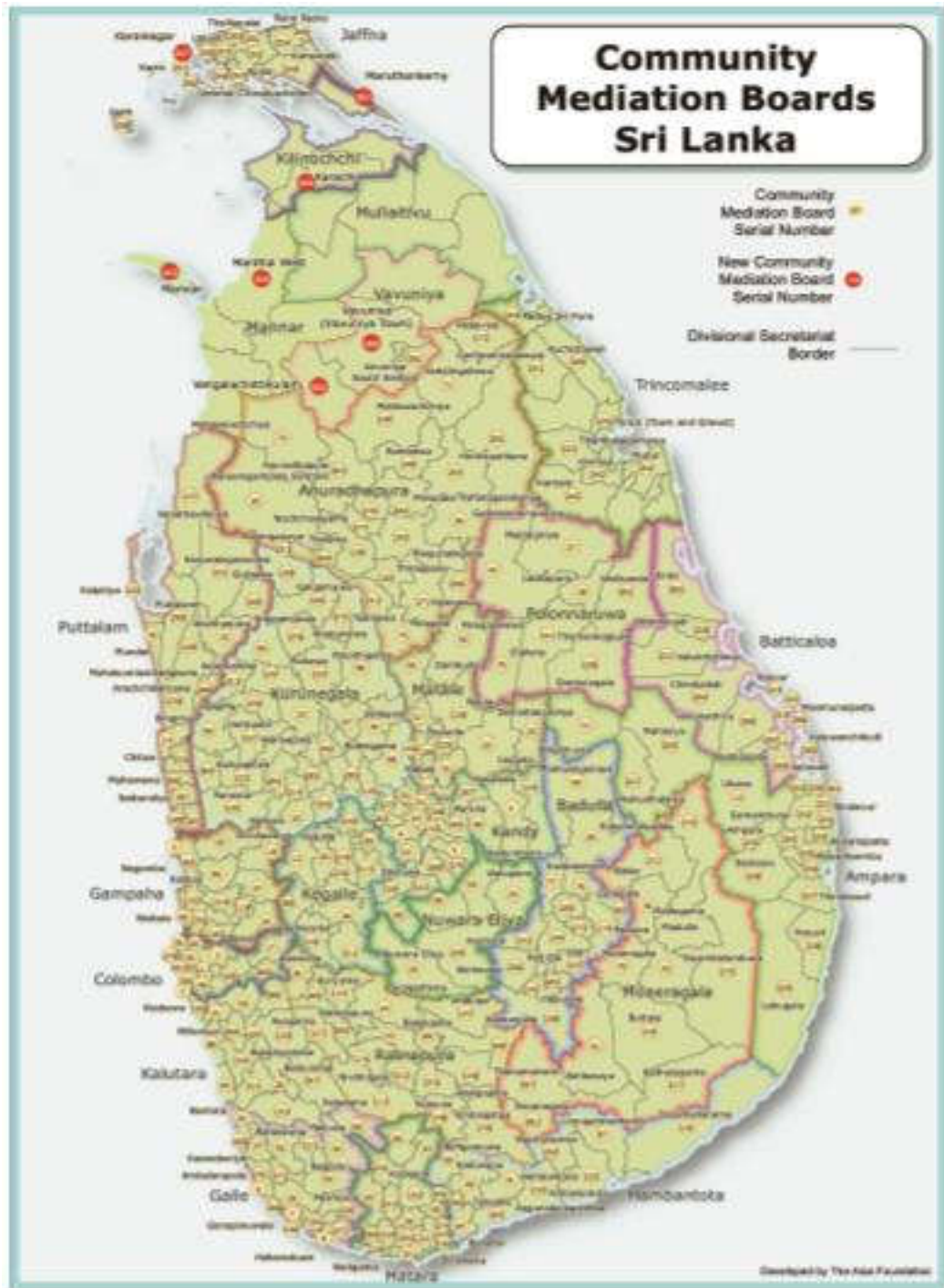
உரு 01: இலங்கையில் செயற்படும் மத்தியஸ்த சபைகளின் அமைவிடம்