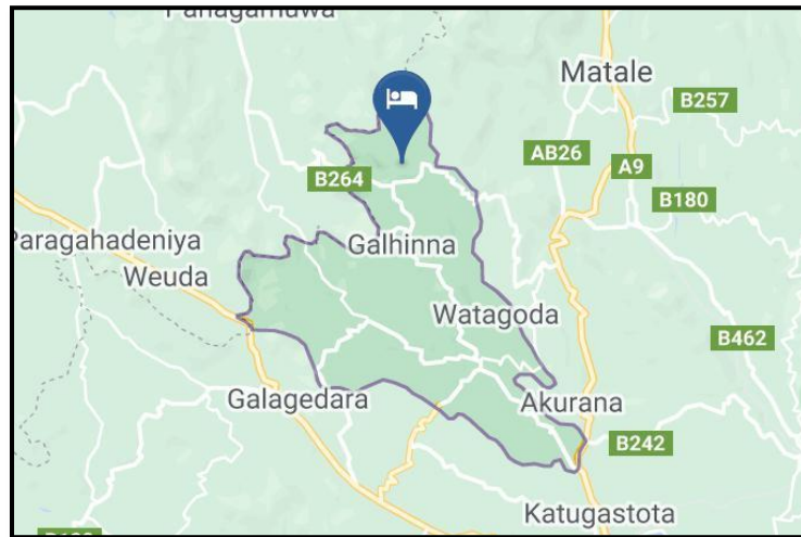
Figure 1: Research Area